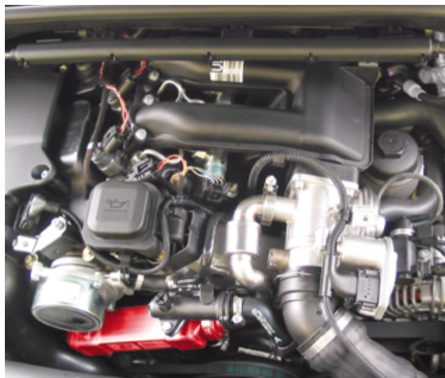
Chłodnica EGR w samochodzie marki BMW 318d (zaznaczona na czerwono)

Pojęcie „tlenki azotu” jest nazwą wspólną dla tlenków azotu w postaci gazowej. Są one oznaczane skrótem NO_x , ponieważ ze względu na wiele stopni utlenienia azotu istnieje wiele związków tlenu z azotem. Tlenki azotu podrażniają i uszkadzają narządy oddechowe, są współodpowiedzialne za powstawanie smogu i ozonu oraz powodują kwaśne deszcze.