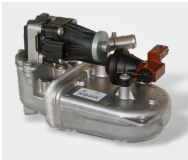
Moduł chłodzący Pierburg EGR ze zintegrowanym zaworem EGR i klapą obejściową, montowany przez Fiata i GM